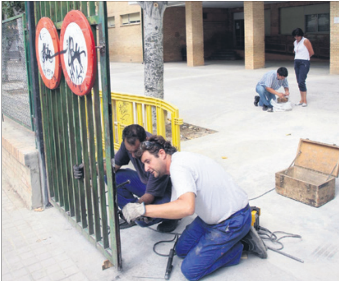
Las brigadas municipales realizan un último control en los centros educativos de la capital oscense. VÍCTOR IBÁÑEZ